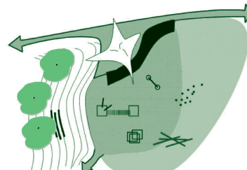
Zintegrowany z otoczeniem